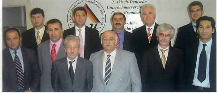
TDU - Vorstandsmitglieder 2005

Kurfürstendamm 175 10707 Berlin Tel: 030 / 88 55 00 00 Fax: 030 / 88 68 30 54 E-Mail: info@tdu-berlin.de